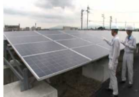
太陽光パネルの外観検査

使用済みとなった太陽光パネルについても、再販売可能なものもある。既に多くのリユース事例が報告されている。