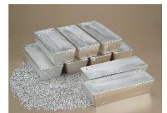
有用金属（銀）のイメージ