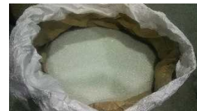
破碎・選別したガラス