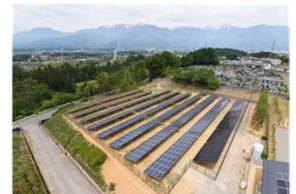
リユース品を使用した発電所