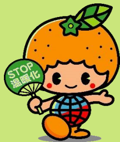
愛媛県地球温暖化防止キャラクター ストップビー