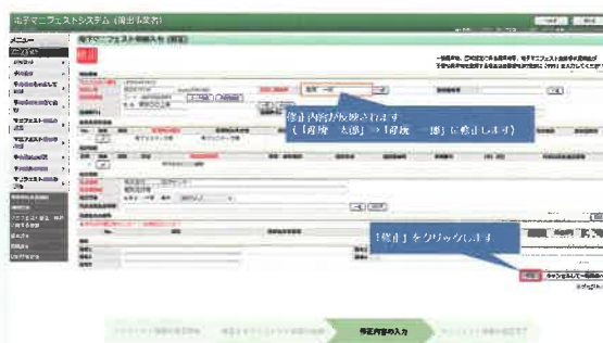
▲マニフェスト情報の修正の一部抜粋